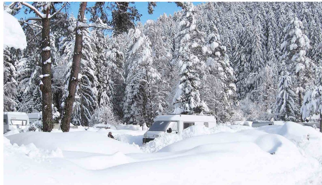
Winterurlaub im Schwarzwald: Viele Plätze wie Camping Bankenhof am Titisee haben auch in der kalten Jahreszeit geöffnet

Immer mehr Campingurlauber entdecken die Region als Winterziel für sich. Denn wenn draußen Schnee liegt, wird es im Camper erst richtig gemütlich